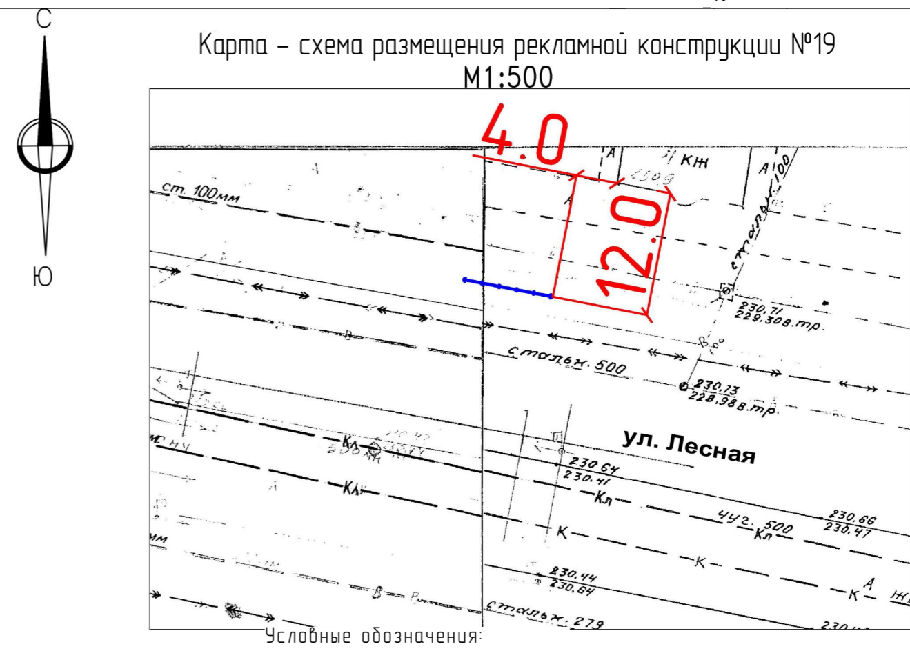
Карта – схема размещения рекламной конструкции №19 М1:500

Условные обозначения: — Место установки рекламной конструкции